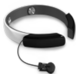
뇌파/맥파 센서 헤드셋